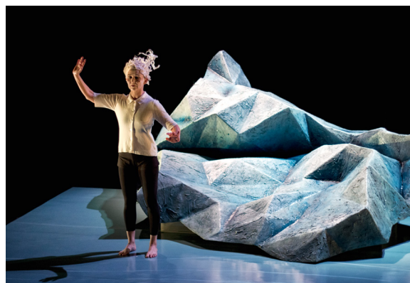
L'Eau douce