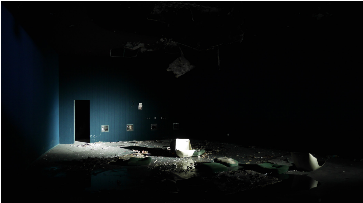
Cinéma Le Mistral

Notre projet comprend également un partenariat avec Valence Romans Agglomération, propriétaire du Mistral et financeur de LUX, via sa direction culture, également en charge, via sa direction économique du développement du Pôle de l'image animée.