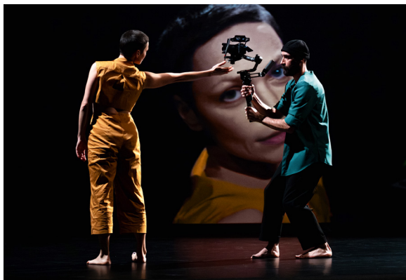
In vista , Yan Raballand