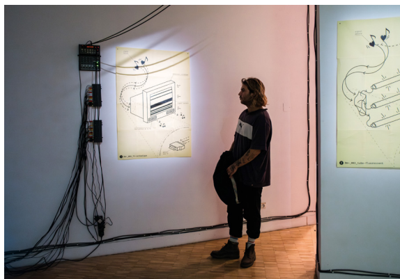
Exposition Dreamachines~ LUX , collectif sin~