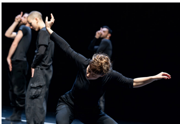
Wakan, un souffle © Michel Petit

Près de 500 participants sont impliqués dans le projet 2 , inscrit dans la cité éducative, et qui bénéficie du soutien logistique et de la communication de la Ville de Valence.