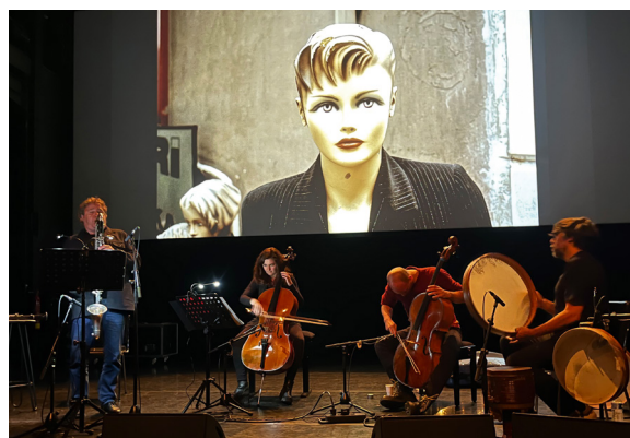
Louis Sclavis, Les Cadences du monde