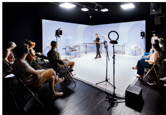
The WhiteOut , Le Clair Obscur