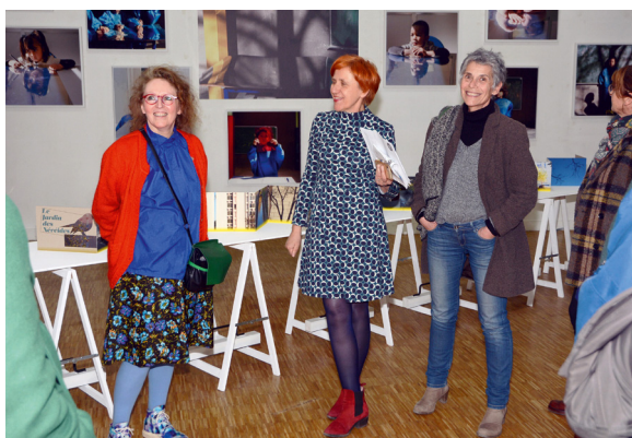
Exposition Votre souvenir brille comme une fête , Yveline Loiseur

Avec Fragments d'humanités , Irvin Anneix a installé ses vidéos et récits de vie, donnant la voix à celles et ceux que l'on entend peu et notamment les adolescents qui dévoilent avec puissance une fraction de leur intimité. Cette installation était inaugurée à l'occasion des restitutions des résidences art et numériques, avec 10 classes de collèves avec lesquelles Irvin a mené toute l'année un projet collaboratif.