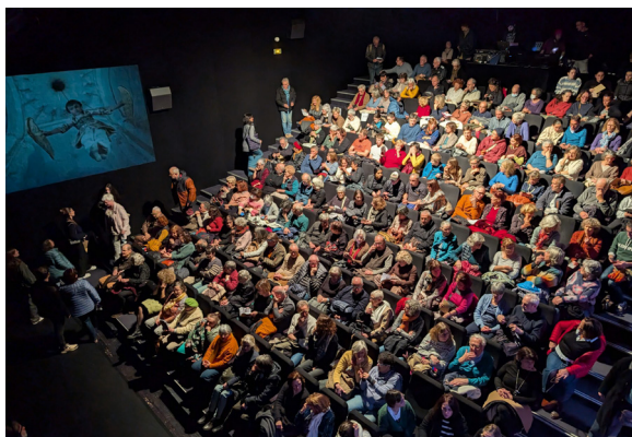
La Couleur de la grenade, Mourad Merzouki

L'édition 2024 a rassemblé 4 730 spectateurs et visiteurs (ils étaient 3 833 en 2023) :