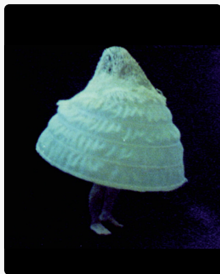
Les Êtres sensibles , Film 15 min. Muriel Moreau