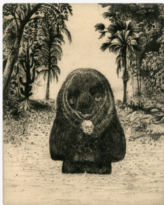
Nour , Gravure à la Pointe sèche, 24x32 cm Didier Hamey