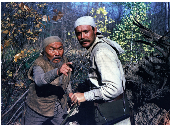
Dersou Ouzala (1976)