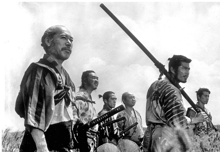
Les 7 Samourais (1954)